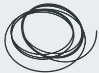
Drahtreste Rests of wire · Kablo atıkları Остатки проволоки