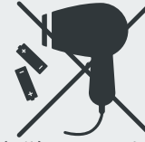
Elektro(-nik)-Geräte und Batterien* Electric/electronic devices and batteries* Elektronik cihazlar ve piller* · Электрические и электронные приборы, батарейки*