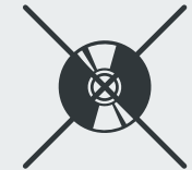
CDs / DVDs CDs / DVDs · CD / DVD Диски CD / DVD