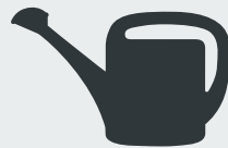
Gießkannen und Blumentöpfe Watering cans and flower pots Çiçek sulama kovası ve saksı Лейки и цветочные горшки