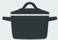
Töpfe und Pfannen Pots and pans · Tencere ve tava Кастрюли, сковородки