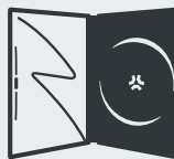
CD- / DVD-Hüllen CD / DVD sleeves · CD / DVD kutusu Упаковки для CD / DVD