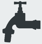
Armaturen (z. B. Wasserhahn) Fixtures · Armatürler · Трубопроводная арматура, например, краны

Plastics and compound materials · Plastik ve bileşik maddeler Пластик и комбинированные материалы