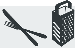
Besteck und Küchenreiben Cutlery and kitchen graters Çatal-Kaşık-Bıçak takımı ve Rendeler Столовые приборы, терки