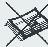
Pappe und Papierabfälle Waste cardboard and paper Karton ve kağıt atık · Karton, makulatura