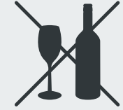
Glas Glass · Cam · Стекло