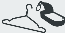
und noch vieles mehr and may more items · ve çok daha fazlası · и многое другое