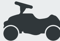
Kinderspielzeug Toys · Çocuk oyuncakları Детские игрушки