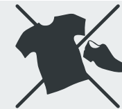
Altkleider und Schuhe Discarded clothing and shoes · Giyim ve ayakkabı · Старая одежда и обувь