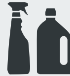
Verpackungen aus Kunststoff Plastic packaging material · Plastik ambalajı · Пластиковые упаковки