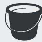
Schüsseln und Eimer Bowls and buckets · Kaseler ve kovalar · Корыта и ведра