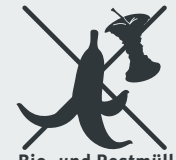
Bio- und Restmüll Residual waste · Organik ve artık çöpler Биологические и остальные бытовые отходы