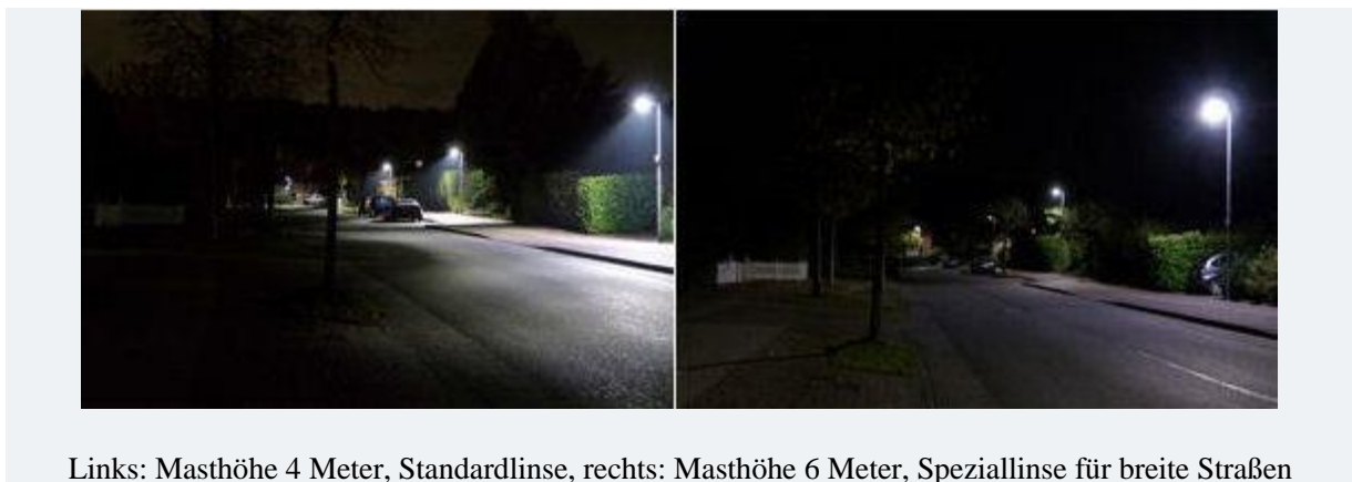
Links: Masthöhe 4 Meter, Standardlinse, rechts: Masthöhe 6 Meter, Speziallinse für breite Straßen

Durch die Aufstellung von höheren Masten in besonders breiten Straßen bzw. an Wendeplätzen kann zusätzlich in Verbindung mit der weiterentwickelten Linse die Ausleuchtung größerer Straßenflächen verbessert werden.